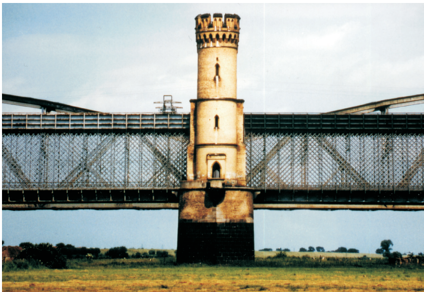
Rys.6. Fragment mostu widziany z boku Fig.6. Side view of a bridge fragment