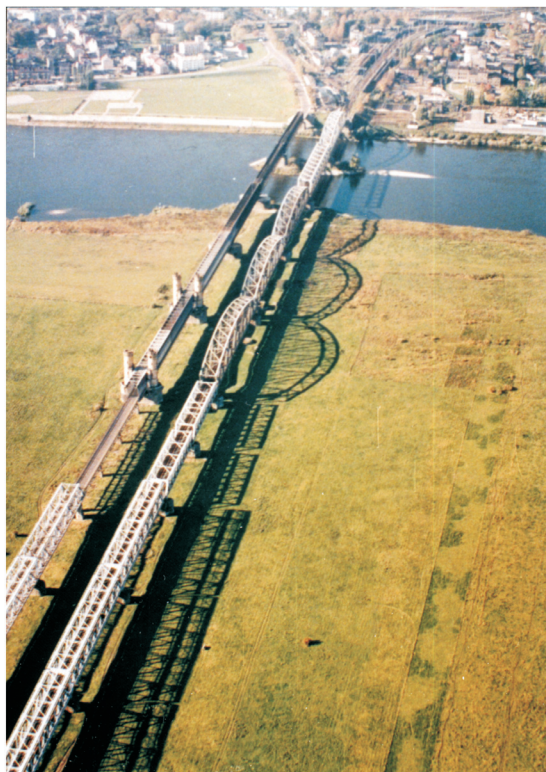
Rys.5. Współczesny widok mostów z lotu ptaka Fig. 5. Contemporary birds eye view of bridges