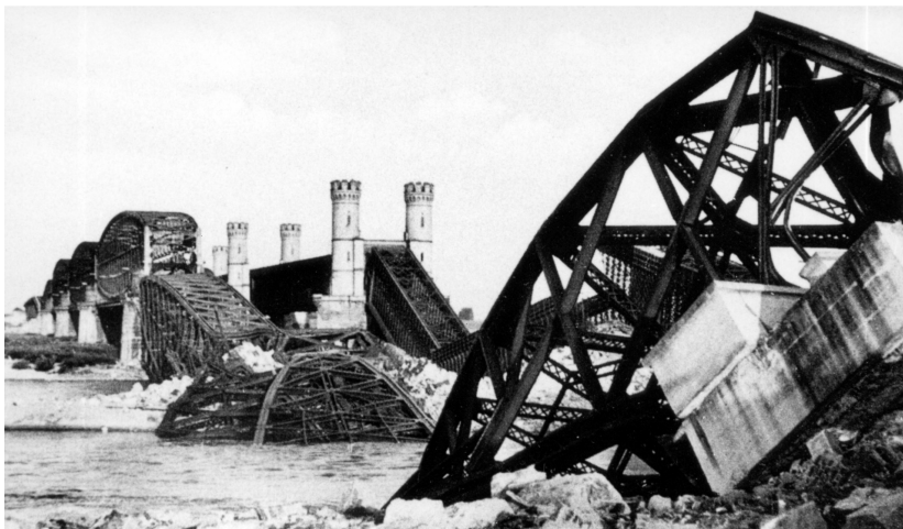
Rys.4. Wojenne zniszczenia mostów w 1939 r. Fig.4. War damages of bridges in 1939