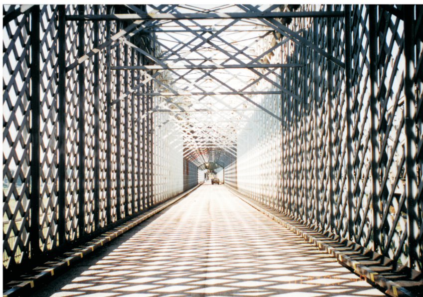
Rys.7. „Wnętrze” mostu Fig.7. „Interior” of bridge