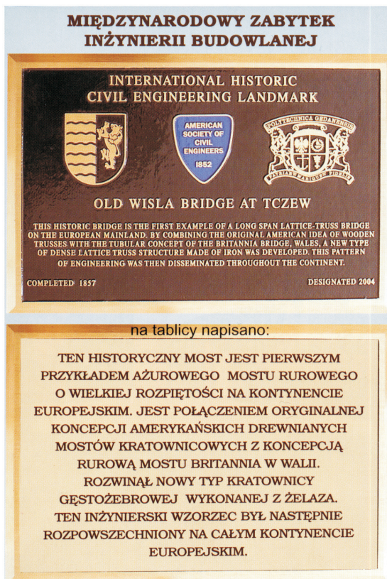
Rys.1. Tablica ASCE na historycznym moście w Tczewie (folder Powiatu Tczewskiego) Fig. 1. ASCE plaque on the historic bridge in Tczew (leaflet of the Tczew County)

Z tej racji omawia się tu krótko tło tego wydarzenia, przybliżając stosowne założenia tego projektu i sam wyróżniony obiekt. Zdarzenie to może być zachętą do rozważenia podjęcia podobnych działań w odniesieniu do innych obiektów w Polsce, a także - do rozpowszechnienia myśli o narodowym, polskim programie tego typu.