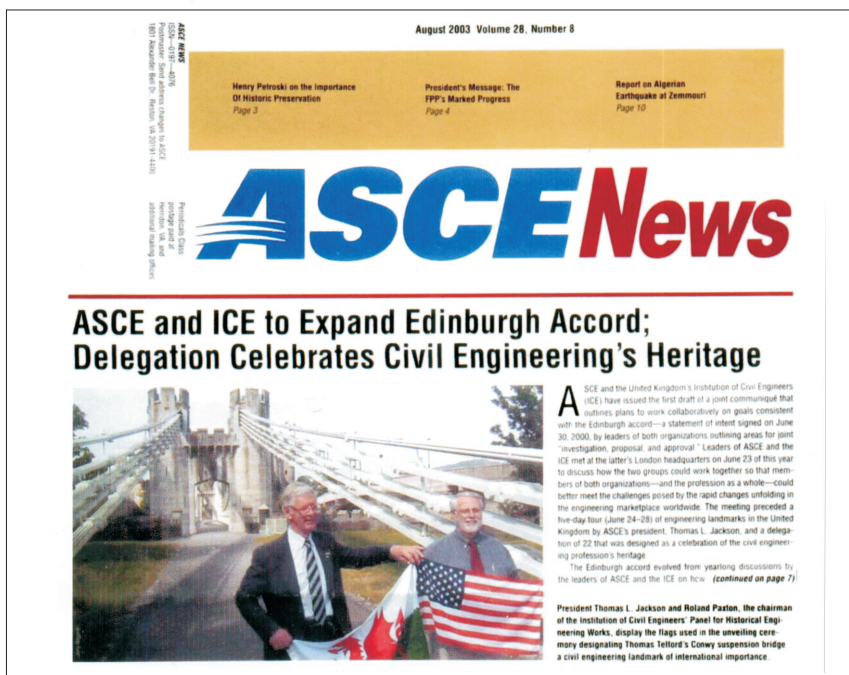
Rys.2. Informacja ASCE o międzynarodowym uhonorowaniu mostu Conwy w Walii (ASCE News 28(2003), 8, 1)

Jak widać, sprawa historii inżynierii budownictwa znalazła się wówczas na pierwszym planie; jest ona zresztą w tym miejscu i dzisiaj (rys. 2).