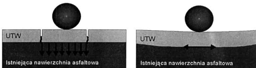
Rys.1. Wpływ rozstawu szczelin [24]

Fig.1. Influence of the distance between joints [24]