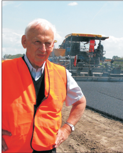
Fig. 2. Construction of the A2 motorway Fot. 2. Budowa autostrady A2

W swojej wieloletniej pracy naukowej prof. Jerzy Pilat opublikował wiele artykułów naukowych, a książki jego współautorstwa takie jak „Nawierzchnie asfaltowe” 8) , „Asfalty drogowe” 9) , „Technologia materiałów i nawierzchni asfaltowych” 10) stanowią kompendium wiedzy dla kolejnych generacji inżynierów budownictwa. Cechą charakterystyczną działalności naukowej Profesora było dążenie do wdrażania wyników badań w praktyce. Wraz z zespołem współpracował z przemysłem, m.in. z Orlenem, Lotosem, TPA, Strabagem, Mostostalem i Budimexem.