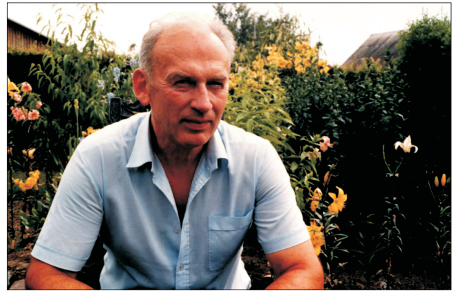
Fig. 5. Gardening passions Fot. 5. Pasje ogrodnicze