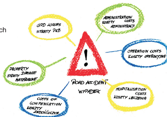
Fig. 1. Cost structure of road accidents Rys. 1. Struktura kosztów wypadków drogowych