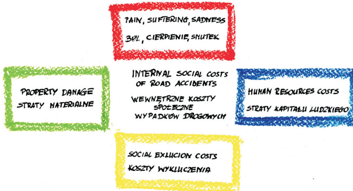
Fig. 2. Categories of social external costs of road accidents in Poland

Rys. 2. Kategorie społecznych kosztów zewnętrznych wypadków drogowych w Polsce